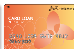
カードローンカード