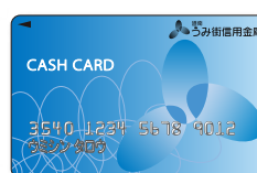
キャッシュカード